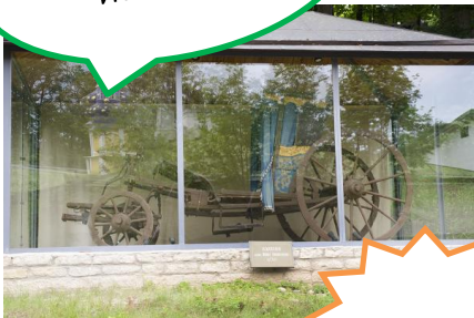
Коляска Анны Иоановны